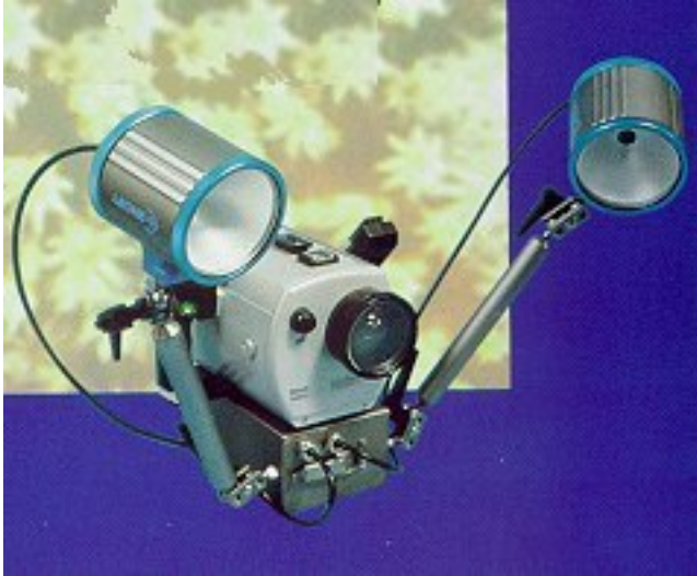
Gruppo illuminante L150